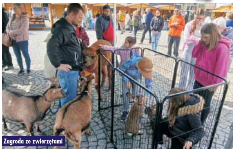
Zagroda ze zwierzętami

12 kwietnia br. na kępińskim Rynku odbył się jarmark wielkanocny. Podczas wydarzenia można było zrobić przedświąteczne zakupy na stoiskach wystawców, a także skosztować smakołyków przygotowanych przez Koła Gospodyń Wiejskich z gminy Kępno. Nie mogło zabraknąć również warsztatów kulinarnych pn. „Żurek wielkopolski według starej receptury” w wykonaniu KGW Borek