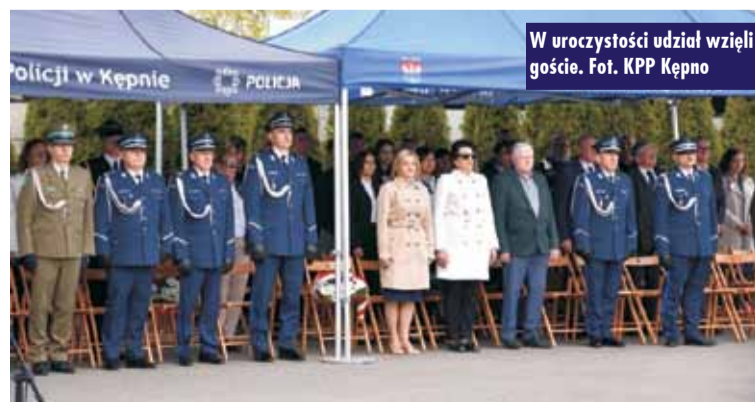
W uroczystości udział wzięli goście.

Pomoc w organizacji obchodów 85. rocznicy Zbrodni Katyńskiej odbyła się dzięki Stowarzyszeniu „Nasz bezpieczny powiat kępiński”. W tym roku wzięli w nim udział przedstawiciele władz samorządowych, organizacji i stowarzyszeń społecznych.