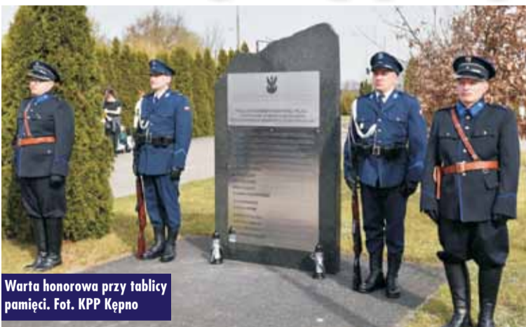
Warta honorowa przy tablicy pamięci.