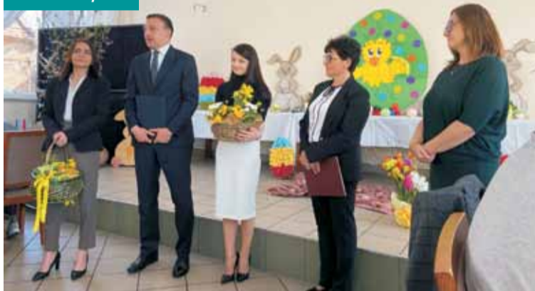
Władze gminy złożyły mieszkańcom życzenia

Dofinansowanie z rządowego programu „KLUB” – edycja 2025 dla Uczniowskiego Klubu Sportowego „Sport Bralin” oraz Ludowego Klubu Sportowego „SOKÓŁ” Bralin