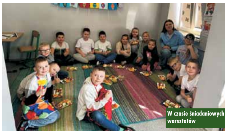
W czasie śniadaniowych warsztatów

Tuż po wykładzie przyszedł czas na emocjonującą rywalizację – quiz dla klas IV-VIII. Pytania wcale nie były łatwe – wymagały sprytu, logicznego myślenia i wiedzy zdobytej podczas spotkań. Ostatecznie o zwycięstwie zdecydowała runda z zagadkami, podczas której liderzy grup musieli nie tylko znać odpowiedź, ale też... wykonać ćwiczenie fizyczne na czas.