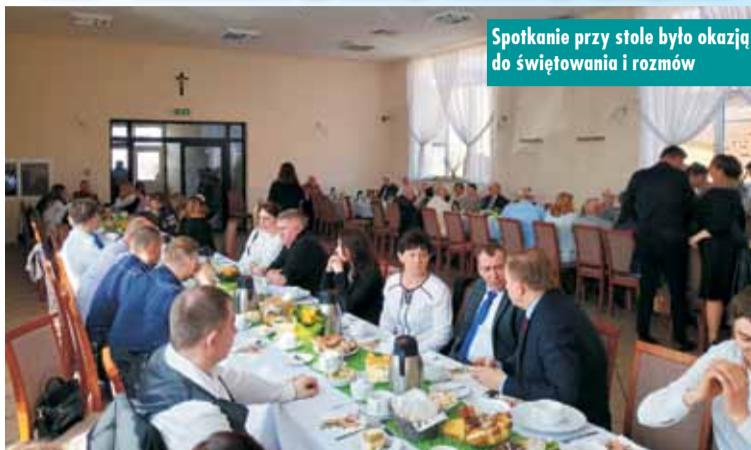
Spotkanie przy stole było okazją do świętowania i rozmów

W Niedzielę Palmową, jak co roku, w Mnichowicach odbyło się tradycyjne śniadanie wielkanocne. Uroczystość zorganizowana przez: sołtysa wraz z Radą Solecką, Koło Gospodyń Wiejskich, Ochotniczą Strażą Pożarną oraz Polski Związek Emerytów, Rentistów i Inwalidów zgromadziła wielu mieszkańców sołectwa.