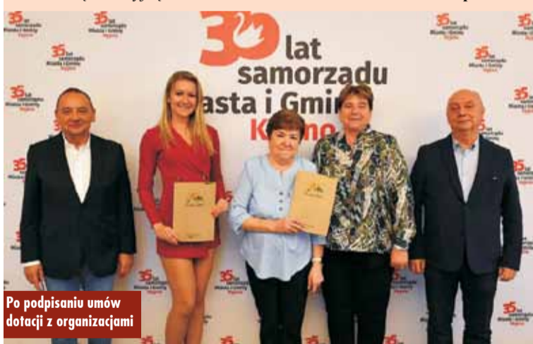
Po podpisaniu umów dotacji z organizacjami

Wykaz dotacji udzielonych przez Powiat w ramach otwartego konkursu ofert na realizację zadań publicznych w obszarze kultury, sztuki, ochrony dóbr kultury i dziedzictwa narodowego w latach 2023-2024