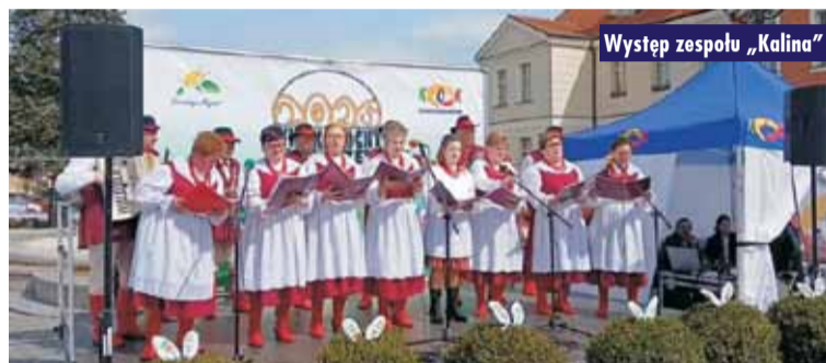
Występ zespołu „Kalina”

12 kwietnia br. na kępińskim Rynku odbył się jarmark wielkanocny. Podczas wydarzenia można było zrobić przedświąteczne zakupy na stoiskach wystawców, a także skosztować smakołyków przygotowanych przez Koła Gospodyń Wiejskich z gminy Kępno. Nie mogło zabraknąć również warsztatów kulinarnych pn. „Żurek wielkopolski według starej receptury” w wykonaniu KGW Borek