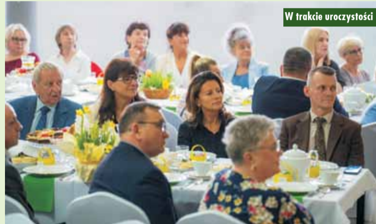
W trakcie uroczystości

kie – od Niedzieli Palmowej po Lany Poniedziałek. Nie zabrakło także