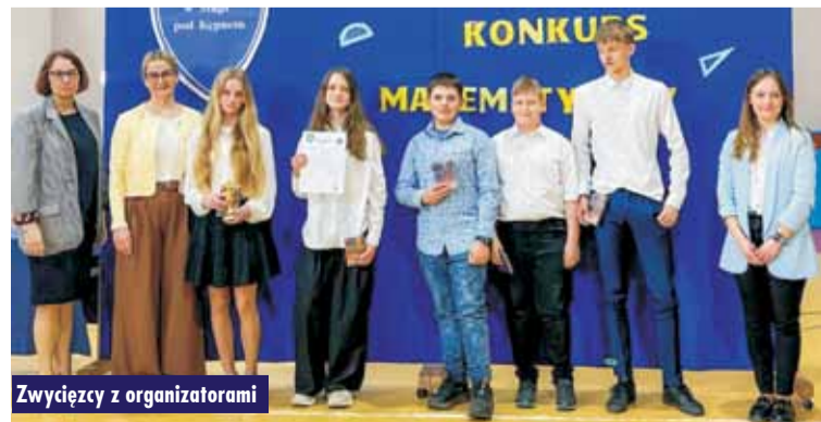
Zwycięzcy z organizatorami