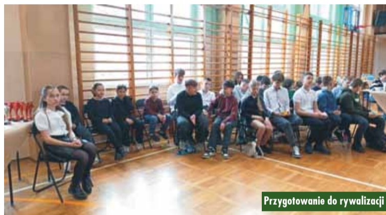
Przygotowanie do rywalizacji