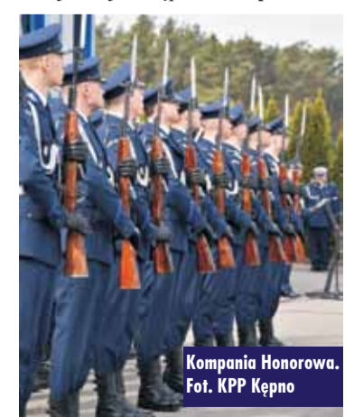
Kompania Honorowa.

wej funkcjonariuszy Komendy Powiatowej Policji w Kępnie. Oprac. KR