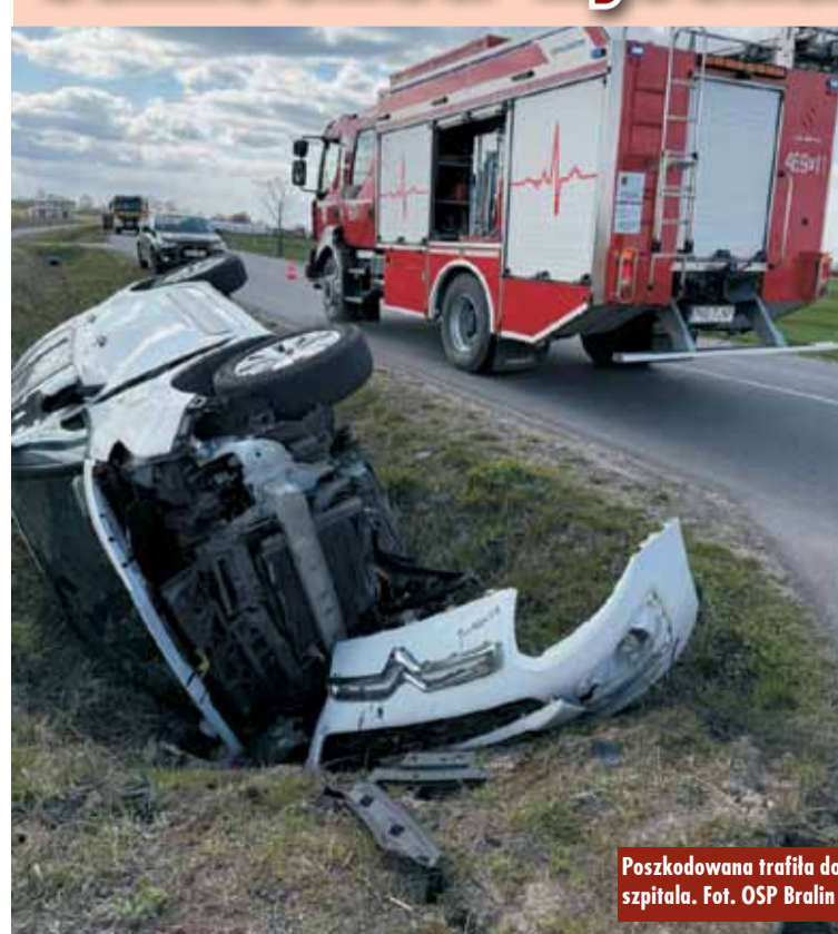
Poszkodowana trafiła do szpitala.