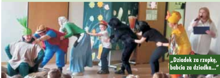
„Dziadek za rzepkę, babcia za dziadka...”