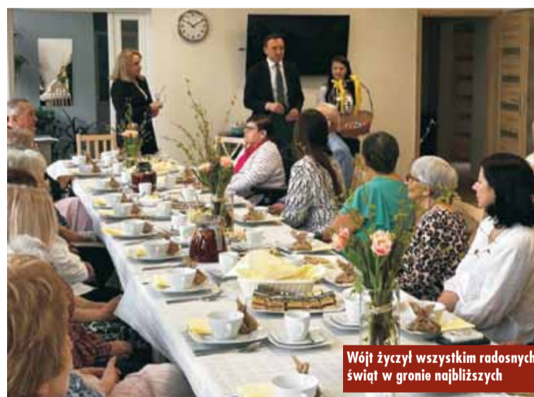
Wójt życzył wszystkim radosnych świąt w gronie najbliższych