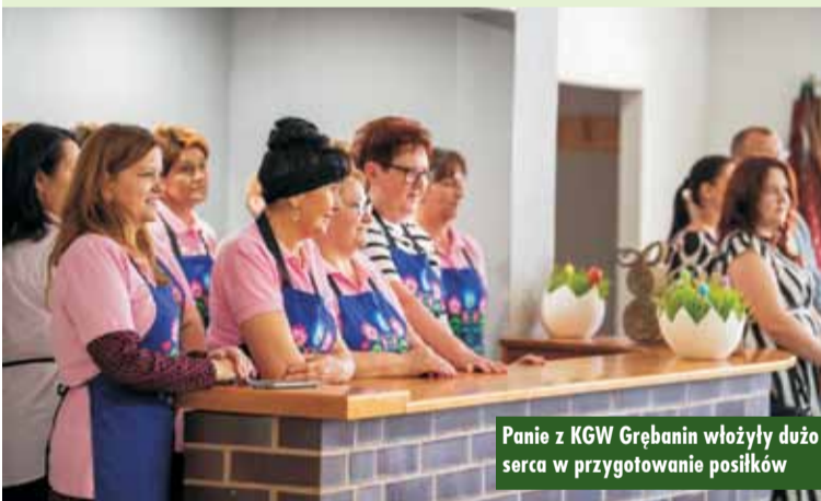
Panie z KGW Grębanin włożyły dużo serca w przygotowanie posiłków

mniej znanych, a niezwykle ciekawych obyczajów, które z pewnością zaskoczyły niejednego widza.