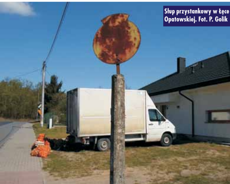
Słup przystankowy w Łęce Opatowskiej.