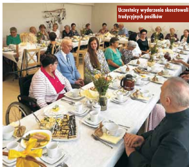
Uczestnicy wydarzenia skosztowali tradycyjnych posiłków