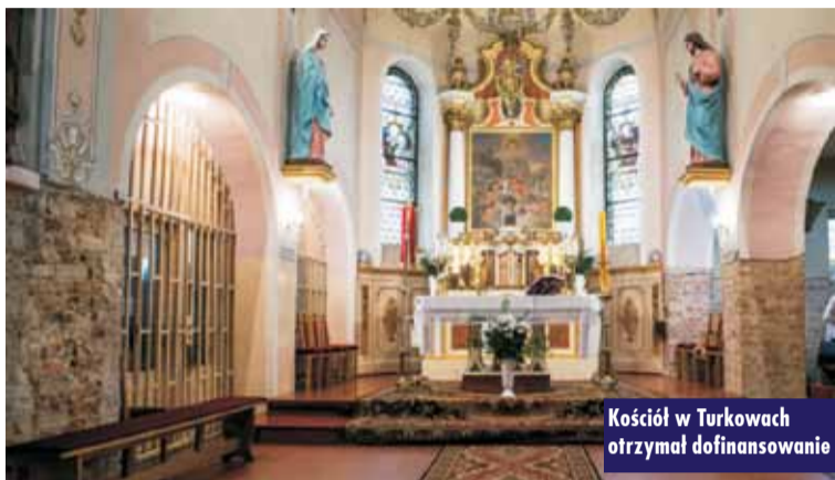
Kościół w Turkowach otrzymał dofinansowanie

W ramach corocznie organizowanego przez Powiat Kępiński otwartego konkursu ofert na realizację zadań publicznych przez organizacje pozarządowe oraz podmioty wymienione w ustawie o działalności pożytku publicznego i o wolontariacie w latach 2023 i 2024, dofinansowano łącznie 7 zadań w ramach naboru ofert, które obejmowały inicjatywy w obszarze kultury, sztuki, ochrony dóbr kultury i dziedzictwa narodowego. m