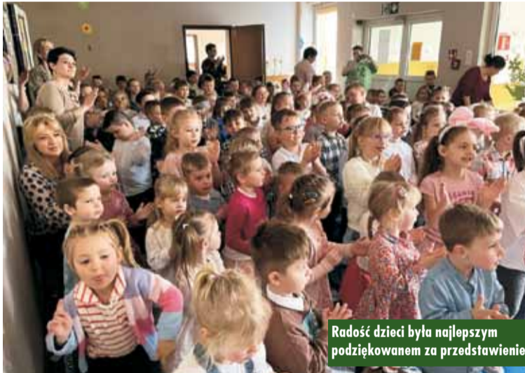
Radość dzieci była najlepszym podziękowaniem za przedstawienie

Trwa przebudowa Stacji Uzdatniania Wody w Myjomicach