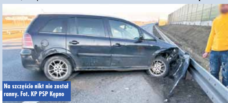
Na szczęście nikt nie został ranny.