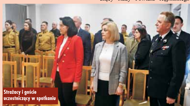
Strażacy i goście uczestniczący w spotkaniu

Komendant przybliżył zebranych gościom i funkcjonariuszom zadania oraz przedsięwzięcia realizowane przez KP PSP Kępno, omówił działalność każdej z komórek organizacyjnych komendy, porównał statystyki odnotowanych zdarzeń w minionych latach oraz wskazał charakterystyczne zdarzenia, które miały miejsce w 2024 r. Wystąpienie było również okazją do podsumowania działań inwestycyjnych oraz poczynionych zakupów w zakresie sprzętu ratowniczo-gaśniczego i szkoleniowego.