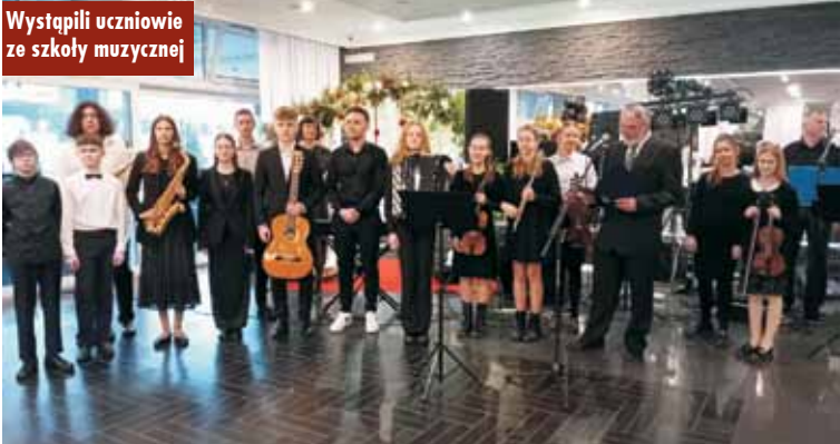
Wystąpili uczniowie ze szkoły muzycznej