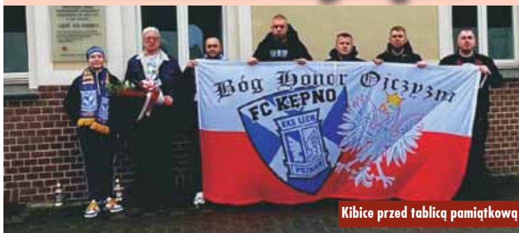
Kibice przed tablicą pamiątkową

Kibice Lecha Poznań, jak co roku, złożyli wiązanek kwiatów i zapalili znicze pod symboliczną ta- blicą pamiątkową, aby oddać cześć tym, którzy po II wojnie światowej walczyli z sowietyzacją Polski i pod- porządkowaniem jej Związkowi Ra- dzieckiemu. W przeszłości kibice z Fan-clubu „Kolejorza” z Kępna byli świadkami pochówku na Powązkach Warszawskich (tzw. Łączka) odna- lezionej doczesnych szczątków Zygmunta Szendzielarza ps. „Łu- paszka”. Brali także udział w uro- czystościach pogrzebowych Danuty Siedzikówny ps. „Inka” oraz Feliksa