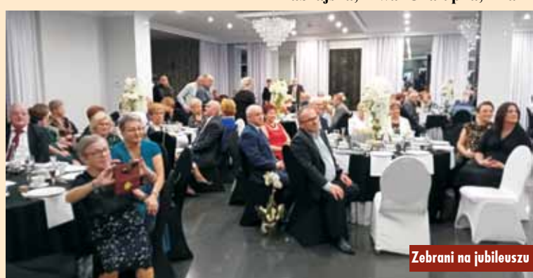
Zebrani na jubileuszu