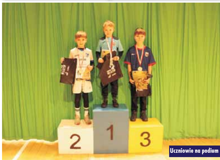
Uczniowie na podium

Drodzy Czytelnicy, „Tygodnik Kępiński” można znaleźć także w internecie. Serdecznie zapraszamy na stronę www.tygodnikkepinski.pl oraz na Facebook pod adres www.facebook.com/tygodnikkepinski