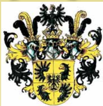
Wizerunek herbu von Pückler odmiana hrabiowska.

Korzenie tej rycerskiej rodziny sięgają XIII wieku. W kronikach wrocławskich przodek rodziny wspomniany jest jako podcaży księcia wrocławskiego. Ród von Pückler (von Pukler) posiadał swoje majątki na Śląsku i Łużycach [5] .