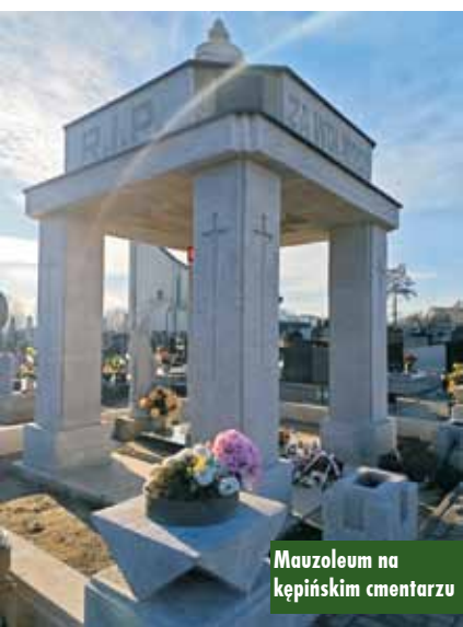
Mauzoleum na kępińskim cmentarzu

Gmina Kępno będzie kontynuowała prace remontowo-konserwatorskie przy Mauzoleum Powstańców