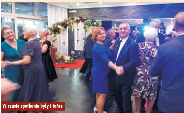
W czasie spotkania były i tańce