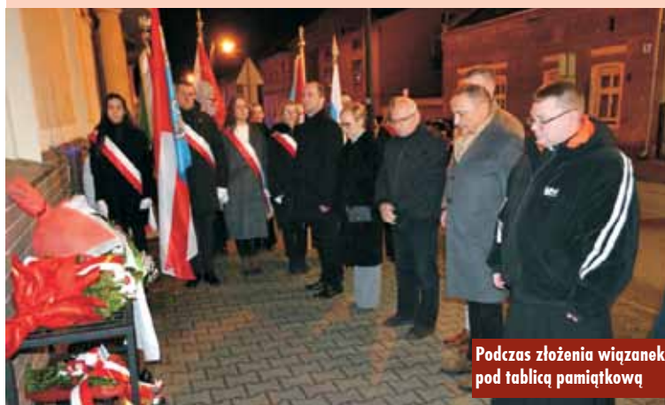
Podczas złożenia wiązanek pod tablicą pamiątkową