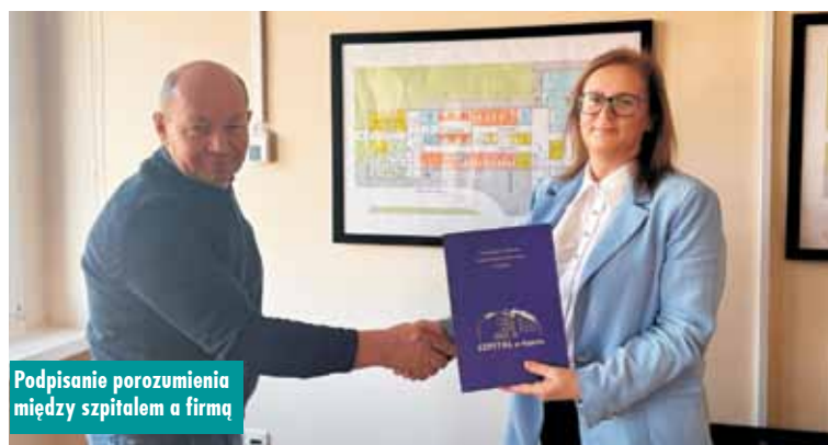
Podpisanie porozumienia między szpitalem a firmą

Oporności. Wniosek jest związany z opieką długoterminową. Dzięki temu projektowi mamy szansę na realizację ważnej inwestycji