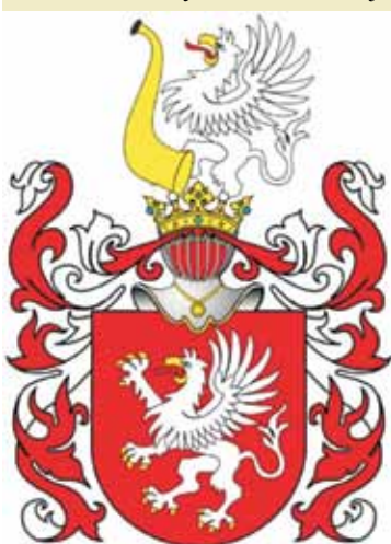
Wizerunek herbu Gryf.

Herb Gryf jest wzmiankowany w najstarszym zachowanym polskim herbarzu, Insignia seu clenodia Regis et Regni Poloniae , spisany przez Jana Długosza i należy do 47 herbów adoptowanych przez bojarów litewskich na mocy unii horodelskiej [3] .