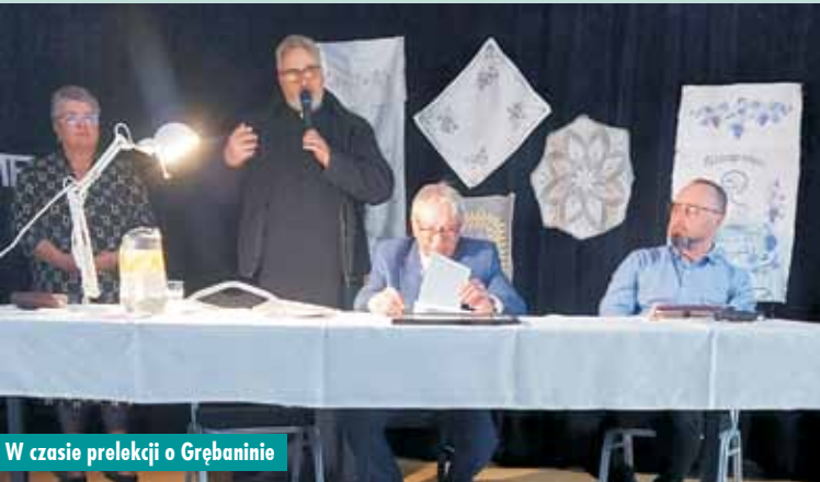
W czasie prelekcji o Grębaninie