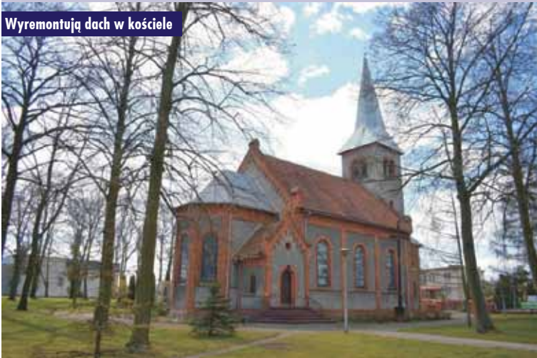
Wyremontują dach w kościele

zostało ogłoszone postępowanie zakupowe na realizację inwestycji pn. „Renowacja dachu w Kościele Filialnym pw. Niepokalanego Serca Maryi w Laskach”. Oprac. m