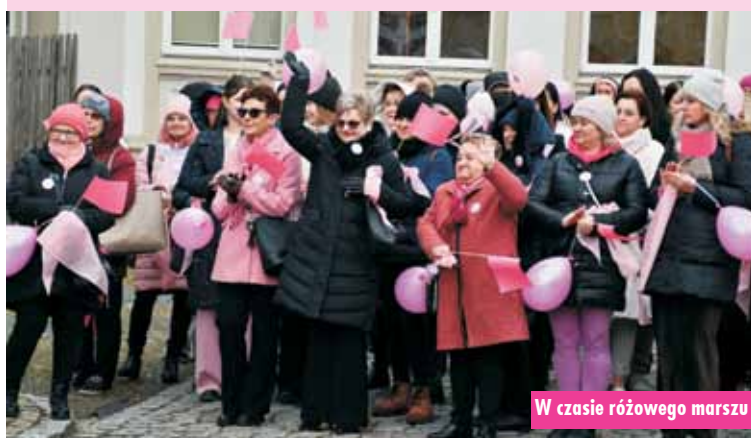
W czasie różowego marszu