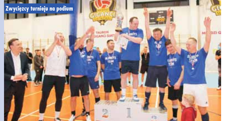
Zwycięzcy turnieju na podium

my wszystkim uczestnikom, a szczególnie brawa należą się drużynie OLD BOY za zwycięstwo. Oprac. KR