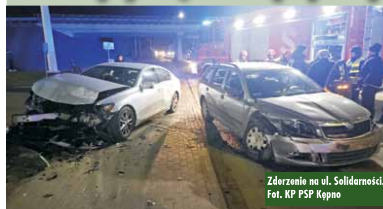
Zderzenie na ul. Solidarności.

21 lutego br., około godziny 19.10, do Stanowiska Kierowania Komendanta Powiatowego Państwowej Straży Pożarnej w Kępnie wpłynęło zgłoszenie o zderzeniu na ul. Solidarności w Kępnie. Na miejsce zdarzenia zadysponowano zastępy z Jednostki Ratowniczo-Gaśniczej w Kępnie i OSP Kępno.