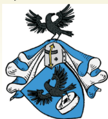
Wizerunek herbu von Poser.

Korzenie rodu von Poser sięgają czasów XIII wieku i wywodzą się od Themo de Poserne (Posar), rycerza księcia śląskiego Henryka V. Ród posiadał swoje majątki w księstwie wrocławskim, oleśnickim, świdnickim, brzeskim, namysłowskim i piastował wysokie urzędy w cesarstwie i wojsku [8] .