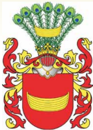
Wizerunek herbu Łódzia.