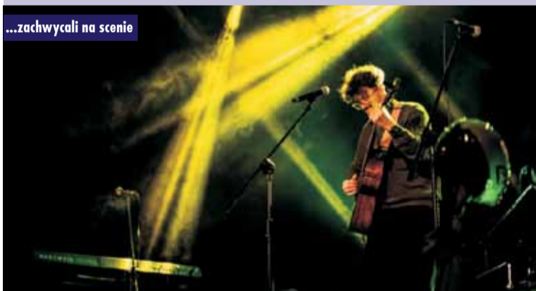
...zachwycali na scenie

siatkę. To kawał przedsięwzięcia – ogrom pracy, zaangażowania sporej liczby ludzi, tak, aby dopiąć wszystkiego na ostatni guzik. Zamieszanie, stres, bieganie, załatwianie – ale to wszystko po to, aby nasza wspaniała publiczność dobrze się bawiła i aby wesprzeć Szymona. Było lirycznie, epicko, nastrojowo, ale i rockowo. A