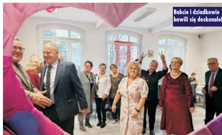
Babcie i dziadkowie bawili się doskonale!

składamy najserdeczniejsze życzenia: zdrowia, szczęścia, radości, a także pociechy ze wszystkich wnuczków. Niech Wasza miłość do wnucząt wraca do Was ze zdwojoną siłą i wypełnia Wasze serca szczęściem! ems