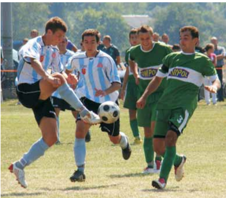
Po dwóch zwycięstwach na otwarcie sezonu przyszła pora na porażkę. W pierwszym meczu w roli gospodarza opatowianie nie dali rady Ostrovii 1909 Ostrów Wielkopolski, ulegając późniejszemu mistrzowi rozgrywek 1:3