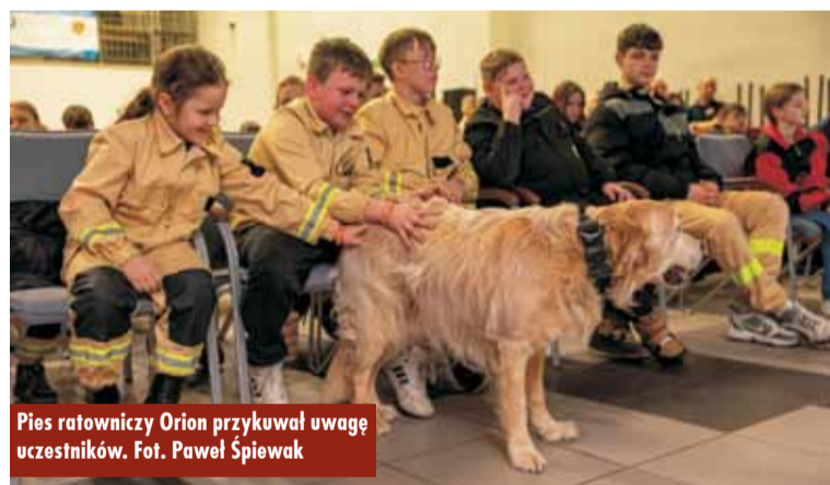
Pies ratowniczy Orion przykuwał uwagę uczestników.

Na zakończenie spotkania najaktywniejsi uczestnicy otrzymali od prelegentów upominki, które będą pamiątką tego wyjątkowego wydarzenia. KR