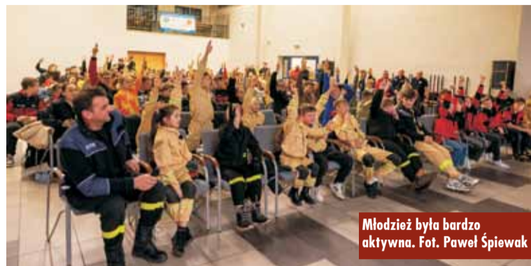
Młodzież była bardzo aktywna.

- Mieliśmy okazję opowiedzieć o działalności Specjalistycznych Grup Poszukiwawczo-Ratowniczych oraz na przykładzie misji „Turcja” mówiliśmy, czym zajmuje się grupa międzynarodowa USAR Poland. Przybliżyliśmy też pracę psów w Państwowej Straży Pożarnej i to, że tych psów, niestety, jest w Polsce niewiele, ale są bardzo istotnymi funkcjonariuszami w całym systemie. Młodzież była bardzo zaangażowana, co było widać po ilości pytań skierowanych do nas oraz aktywności podczas odpowiadania na nasze pytania, co bardzo cieszy. Widać moc w narodzie. Uważam, że takie spotkania są bardzo ciekawe, wartościowe i potrzebne, ponieważ zapewne wielu z tych młodych ludzi zastanawia się nad zawodową służbą w PSP, a my możemy im pokazać, że