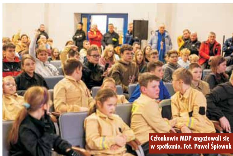
Członkowie MDP zaangażowali się w spotkanie.

Mamy nadzieję, że to wydarzenie rozpalilo pasję do ratownictwa wśród kępińskiej młodzieży i zmotywowało ją do dalszego rozwijania swoich umiejętności w ramach Młodzieżo-