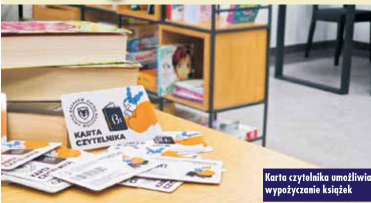
Karta czytelnika umożliwia wypożyczanie książek

Księżkomat to pierwsze urządzenie w okolicy, które pozwala na odbiór lub zwrot zamówionych książek z księgozbioru Gminnej Biblioteki Publicznej w Baranowie. Jest dostępny o każdej porze. Ma 18 skrytek, panel do obsługi czytelnika i oprogramowanie. Aby skorzystać z księżkomatu, wystarczy być zarejestrowanym czytelnikiem i złożyć zamówienie z katalogu bibliotecznego online. Do otwarcia skrytki księżkomatu konieczna jest karta biblieczna. Od stycznia tego roku zostały wprowadzone nowe plastikowe karty czytelnika. Karta wydawana jest bezpłatnie w siedzibie biblioteki i przypisana jest dla każdego użytkownika. Czytelnik może również identyfikować się w księżkomacie, skanując kartę biblioteczną z aplikacji telefonicznej