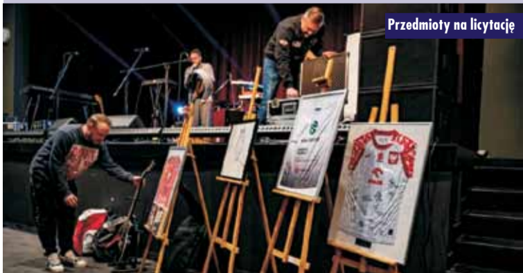
Przedmioty na licytację

Patronat na koncercie objęło Radio SUD i Stowarzyszenie „Po prostu pomagam”. KR