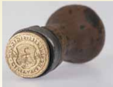
Pieczęć miejska Kępna w formie okrągłego tłoku. W polu herb Kępna z datą 1661, na otoku inskrypcja: CIVITATIS KEMPENSIS SIGILLUM.

Dzięki dalszemu napływowi do Kępna ludności wyznania luteranckiego, będącej w większości rzemieślnikami i kupcami, nastąpił dalszy gospodarczy rozwój Kępna. Dlatego Adam Franciszek z Rudnik