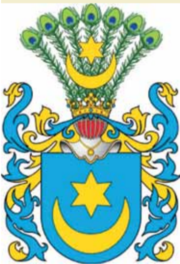
Wizerunek herbu Leliwa.

Herb Leliwa jest wzmiankowany w najstarszym zachowanym polskim herbarzu: Insignia seu clenodia Regis et Regni Poloniae , spisany przez Jana Długosza [2] . Herb ten należy do 47 herbów adoptowanych przez bojarów litewskich na mocy unii horodelskiej. Herb występował głównie w ziemi krakowskiej, sandomierskiej i poznańskiej. Pochodzenie herbu nie jest jasne, historycy spierają się, czy herb ten pochodzi z Niemiec czy należy do herbów rodzimych. Legenda herbowa mówi, że herb ten otrzymał rycerz za pokonanie wrogiego wojska przy księżycu i gwiazdach w czasach Bolesława Wstydlivego [3] .