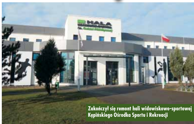
Zakończony remont hali widowiskowo-sportowej Kępnińskiego Ośrodka Sportu i Rekreacji

Zakończył się II etap remontu hali widowiskowo-sportowej Kępnińskiego Ośrodka Sportu i Rekreacji. Wykonawcą zadania była firma KiK z Ostrzeszowa.