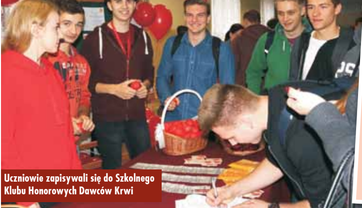
Uczniowie zapisywali się do Szkolnego Klubu Honorowych Dawców Krwi

22 listopada br. w Zespole Szkół Ponadgimnazjalnych nr 1 w Kępnie odbyło się spotkanie promujące wśród uczniów oddawanie krwi. Uczestnicy dowiedzieli się między innymi najważniejszych informacji odnośnie oddawania krwi, przeciwwskazań oraz tego, jak odpowiednio przygotować się do zostania krwiodawcą. Dodatkowo rozdawane były gadzety promujące RCKiK oraz zapisy do Szkolnego Klubu Honorowych Dawców Krwi.