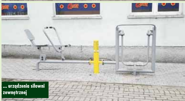
... urządzenia siłowni zewnętrznej

Rada Gminy Perzów uchwaliła stawki podatku od nieruchomości, od środków transportowych, zatwierdziła również taryfy za zbiorowe zaopatrzenie w wodę i odprowadzanie ścieków