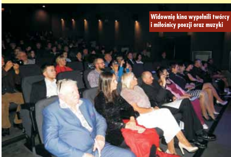
Widownię kina wypełnili twórcy i miłośnicy poezji oraz muzyki

Wydarzenie pod patronatem Burmistrza Miasta i Gminy Kępno dofinansowano ze środków Ministra Kultury i Dziedzictwa Narodowego. bem