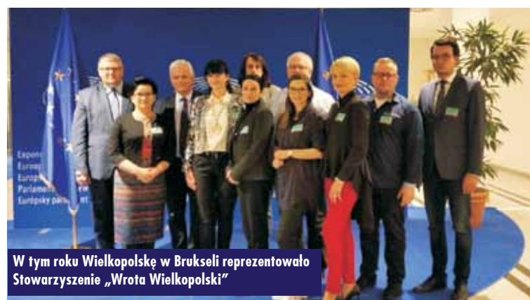
W tym roku Wielkopolskę w Brukseli reprezentowało Stowarzyszenie „Wrota Wielkopolski”