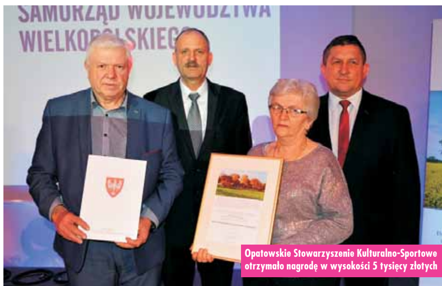
Opatowskie Stowarzyszenie Kulturalno-Sportowe otrzymało nagrodę w wysokości 5 tysięcy złotych

im instytucje oraz organizacje i podmioty gospodarcze z terenu województwa wielkopolskiego.