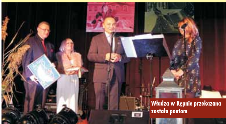
Władza w Kępnie przekazana została poetom