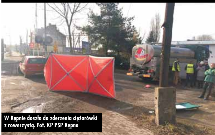
W Kępnie doszło do zderzenia ciężarówki z rowerzystą.

Do tragicznego w skutkach wypadku drogowego doszło w 24 listopada br., przed godz. 10.00, na ul. Poznańskiej w Kępnie.