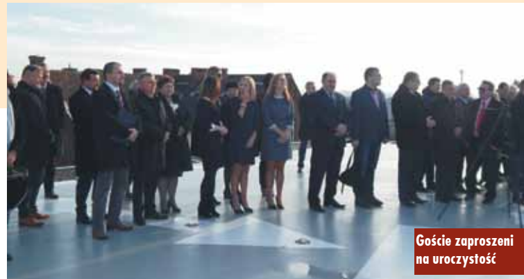
Goście zaproszeni na uroczystość