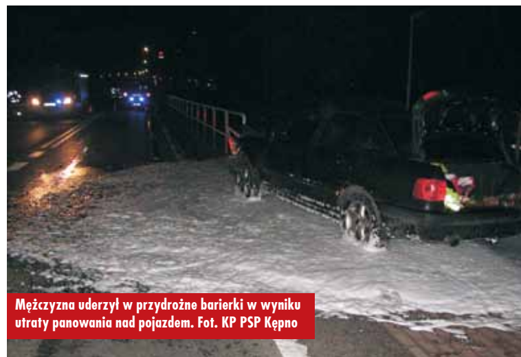
Mężczyzna uderzył w przydrożne barierki w wyniku utraty panowania nad pojazdem.

zgłoszenie o kolizji, do której doszło na dawnej „ósemce” w Chojęcinie. Samochód osobowy uderzył tam w przydrożne barierki.