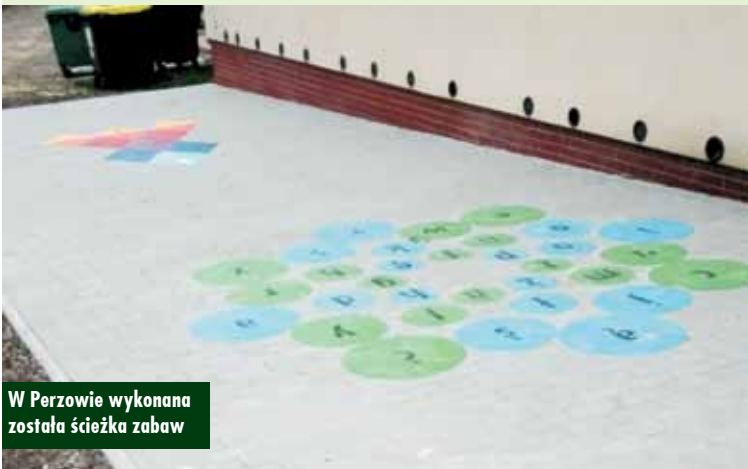
W Perzowie wykonana została ścieżka zabaw

infrastruktury rekreacyjnej w gminie Perzów. Miejsca rekreacji poza tymi w Perzowie i Słupi, powstały również w Miechowie i Domasławie. Zadanie współfinansowane było ze środków Unii Europejskiej w ramach poddziałania „Wsparcie na wdrażanie operacji w ramach strategii rozwoju lokalnego kierowanego przez społeczność” objętego Programem Rozwoju Obszarów Wiejskich na lata 2014-2020. Na realizację zadania przeznaczone zostały środki własne w wysokości 73.072,79 zł. Otrzymana pomoc finansowa wynosi 127.842,00 zł.