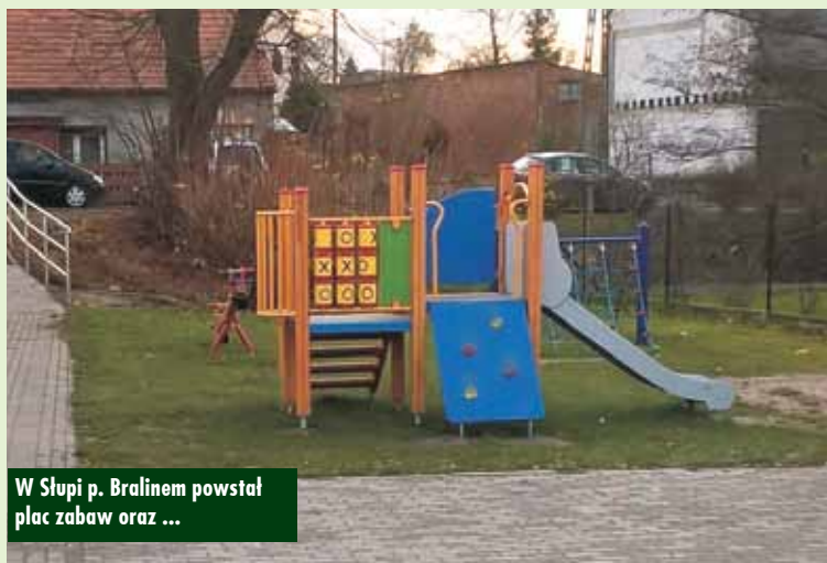
W Słupi p. Bralinem powstał plac zabaw oraz ...

Investycje zrealizowane zostały w ramach zadania pn. „Budowa