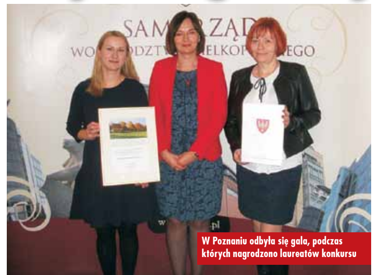
W Poznaniu odbyła się gala, podczas której nagrodzono laureatów konkursu

Nagrodzony został projekt pn. „Gminny festyn rodzinny z okazji Dnia Matki i Dziecka ze smokiem w tle”.