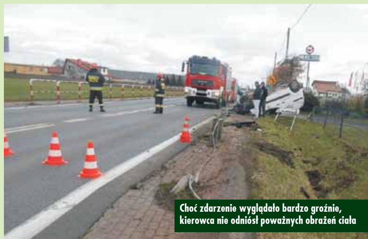
Choć zdarzenie wyglądało bardzo groźnie, kierowca nie odniósł poważnych obrażeń ciała