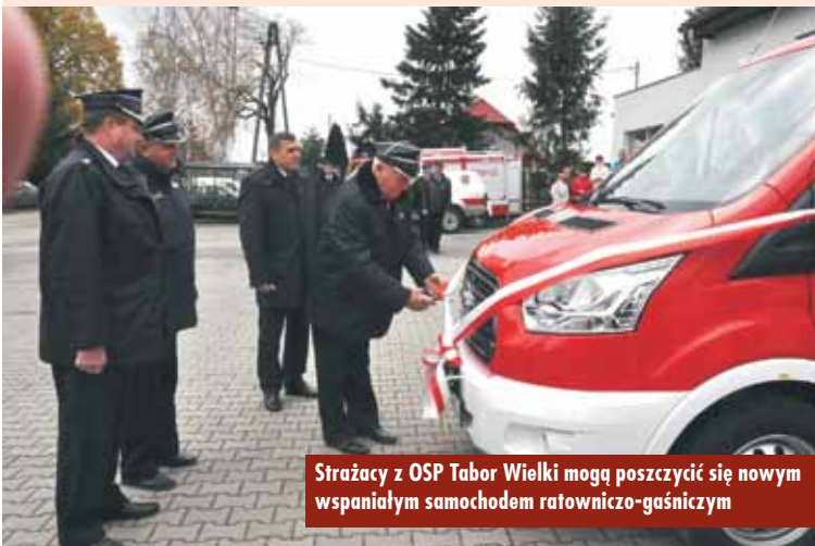
Strażacy z OSP Tabor Wielki mogą poszczycić się nowym wspaniałym samochodem ratowniczo-gaśniczym

Akcja „Misie Ratownisie” w Zespole Szkół im. Ks. Michała Przywary i Rodziny Salomonów w Nowej Wsi Książęcej