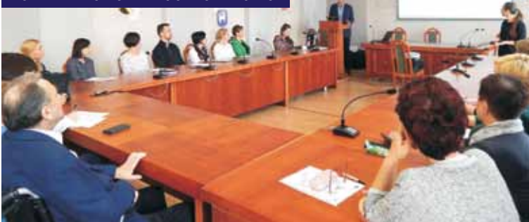
Uczestnicy spotkania zapoznali się z narzędziem wsparcia deinstytucjonalizacji pieczy zastępczej

Aplikacja ta ma być przekazana do Ministerstwa Rodziny, Pracy i Polityki Społecznej, celem wykorzystania jej w stworzeniu rankingu powiatów i bazy danych dotyczących działań podejmowanych na rzecz rodzinnej pieczy zastępczej.