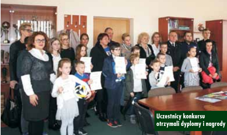
Uczestnicy konkursu otrzymali dyplomy i nagrody

16 listopada br. w Komendzie Powiatowej Policji w Kępnie odbyło się uroczyste wręczenie nagród uczestnikom konkursu pt. „Nie truj siebie i sąsiadów. STOP SMOG”. Konkurs został zorganizowany przez Komendę Powiatową Policji w Kępnie przy współpracy Państwowej Straży Pożarnej, Powiatowej Stacji Sanitarnej-Epidemiologicznej w Kępnie oraz Stowarzyszenia „Nasz bezpieczny powiat kępiński”.