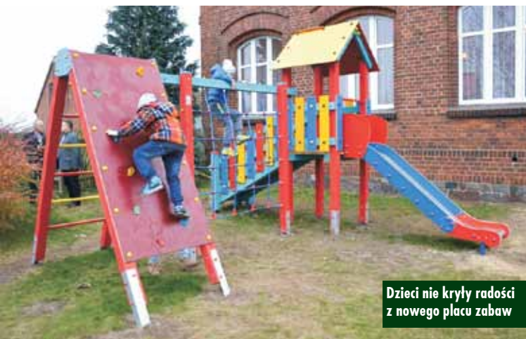
Dzieci nie kryły radości z nowego placu zabaw

7 listopada br. w Łęce Opatowskiej odbyły się Mistrzostwa Gminy w Unihokeju Dziewcząt i Chłopców w ramach XIX Igrzysk Dzieci