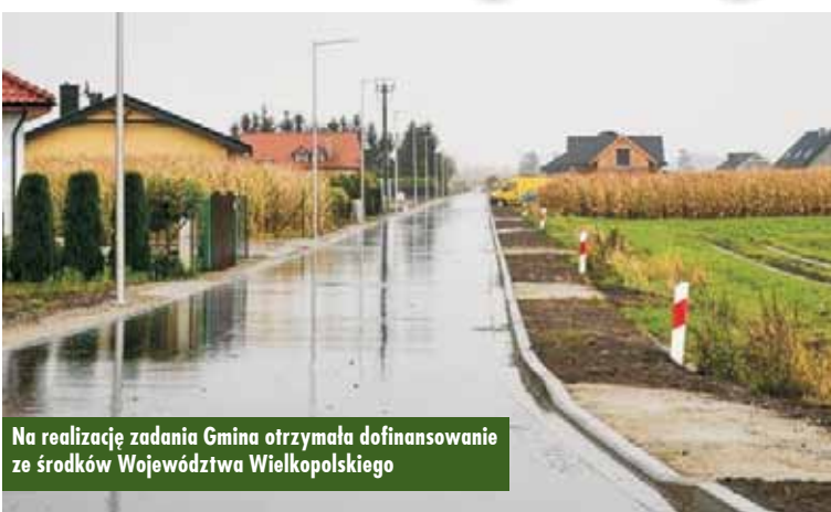
Na realizację zadania Gmina otrzymała dofinansowanie ze środków Województwa Wielkopolskiego

Gmina Baranów, jak co roku, przeprowadziła przebudowę dróg gminnych stanowiących dojazd do gruntów rolnych, na których nawierzchnię gruntową zastąpiono nawierzchnią bitumiczną lub z kruszywa łamanego. W bieżącym roku przebudowana została droga gminna nr 852 535 w Baranowie na długości 0,6 km. Łączna wartość wykonanych robót wyniosła 1.229.577,48 zł. Na realizację wymienionego zadania Gmina Baranów uzyskała dofinansowanie ze środków Województwa Wielkopolskiego w kwocie 77.500,00 zł.