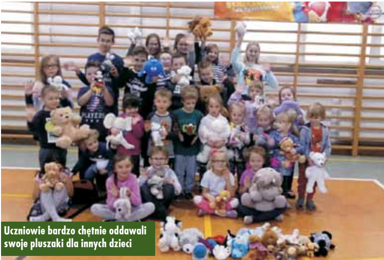
Uczniowie bardzo chętnie oddawali swoje pluszaki dla innych dzieci