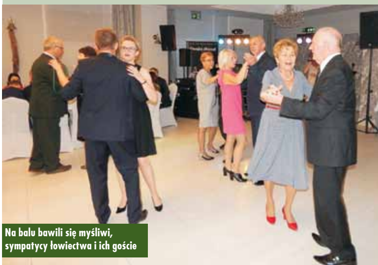
Na balu bawili się myśliwi, sympatycy łowiectwa i ich goście