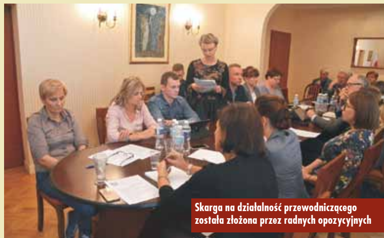
Skarga na działalność przewodniczącego została złożona przez radnych opozycyjnych

letą Słupianek . Kością niezgody stało się tu m.in. sformułowanie, że podczas spotkania „wójt przedstawi-