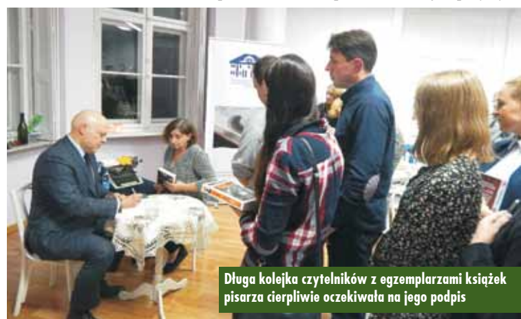
Długa kolejka czytelników z egzemplarzami książek pisarza cierpliwie oczekiwała na jego podpis

warsztatu pisarskiego. Opowiedział, jak kompletuje informacje pozwalające mu wiarygodnie opisywać życie Wrocławia i Lwowa sprzed lat. Wskazał źródła, stanowiące prawdziwe kompendium szczegółów składających się na barwny obraz dawnych realiów. Dzięki studiowaniu przez