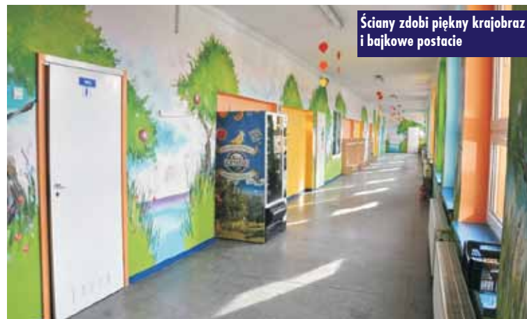
Ściany zdobi piękny krajobraz i bajkowe postacie

Kolarze z UKS Sport Bralin rywalizowali w Kluczewsku w ramach II serii Orlen Pucharu Polski