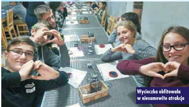
Wycieczka obfitowała w niesamowite atrakcje

Od 6 do 7 listopada br. klasy IV i VII szkoły podstawowej oraz II gimnazjum Szkoły Podstawowej nr 2 w Kępnie uczestniczyły w naukowej wycieczce do Torunia, organizowanej w ramach realizacji projektu „Experymentarium matematyczno-przyrodnicze”.