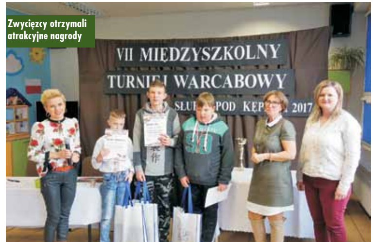
Zwycięzcy otrzymali atrakcyjne nagrody

Udział w tego typu konkursach działa motywująco na uczniów, pozwala znacznie wyrównać ich szanse