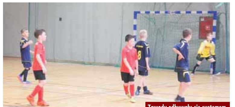
Zawody odbywały się systemem „każdy z każdym”

Do etapu powiatowego zakwalifikowali się młodzi piłkarze z Łęki Opatowskiej