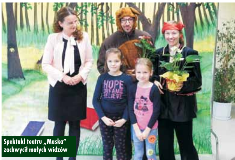
Spektakl teatru „Maska” zachwycił małych widzów

11 listopada br. członkowie klubu Sparta Laski dokonali podsumowania sezonu sportowego