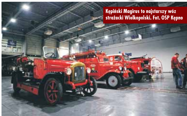
Kępiński Magirus to najstarszy wóz strażacki Wielkopolski.

Druhowie z jednostki Ochotniczej Straży Pożarnej w Kępnie mieli kolejną możliwość prezentacji kępińskiego „Dziadka” – czyli zabytkowego Magirusa.