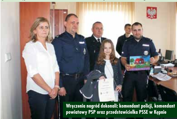
Wręczenia nagród dokonali: komendant policji, komendant powiatowy PSP oraz przedstawicielka PSSE w Kępnie