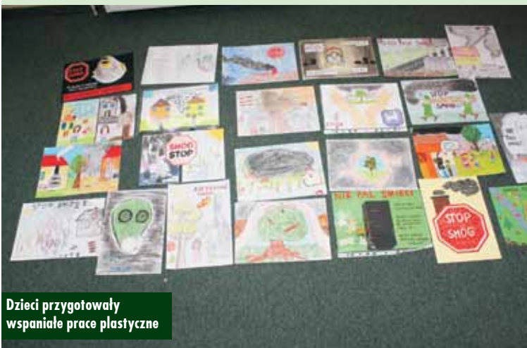
Dzieci przygotowały wspaniałe prace plastyczne

Dwie osoby zostały poszkodowane w wyniku zdarzenia na drodze krajowej nr 11 w Hanulinie