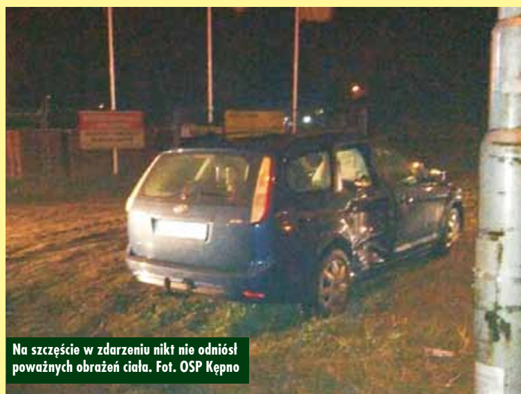
Na szczęście w zdarzeniu nikt nie odniósł poważnych obrażeń ciała.

Kępiński Magirus częścią wystawy podczas targów Retro Motor Show