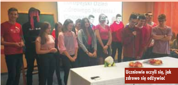
Uczniowie uczyli się, jak zdrowo się odżywiać

Europejski Dzień Zdrowego Jedzenia i Gotowania został zainicjowany w 2007 roku przez komisarzy Unii Europejskiej i Euro-Toques - organizację zrzeszającą znanych szefów kuchni. Celem święta jest: promowanie zdrowego jedzenia wśród młodzieży, dobrych nawyków żywieniowych, spożywania regularnie posiłków i informowanie o konsekwencjach złej diety.