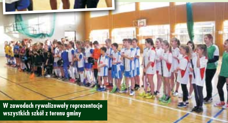
W zawodach rywalizowały reprezentacje wszystkich szkół z terenu gminy

KOŃCOWA KLASYFIKACJA TURNIEJU Dziewczęta: 1 - SP Łęka Opatowska 2 - SP Siemianice 3 - SP Opatów 4 - SP Trzebień Chłopcy: 1 - SP Trzebień 2 - SP Łęka Opatowska 3 - SP Siemianice 4 - SP Opatów