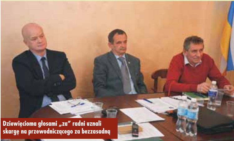
Dziewięćmioma głosami „za” radni uznali skargę na przewodniczącego za bezzasadną

Dziewięćmioma głosami „za” radni uznali jednak skargę za bezzasadną. KR